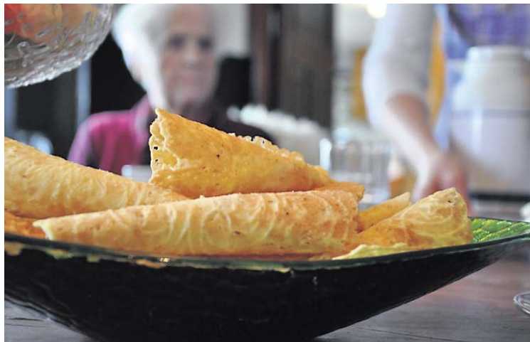
Til kaffen: Kromkaker.